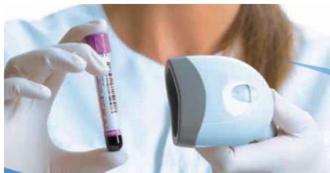
Scanner kann nur auf einen Blick lesen, nicht rundum.